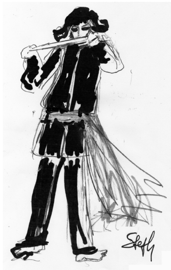
Le Jeune Indien