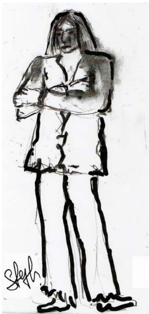
Le Vieil Indien

créé en 1996 aux Etats-Unis inédit en France