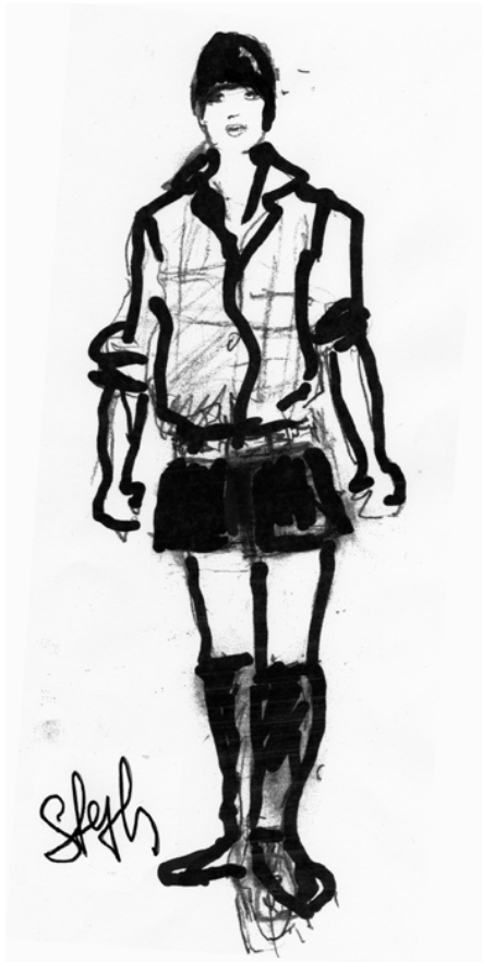
La Jeune Fille